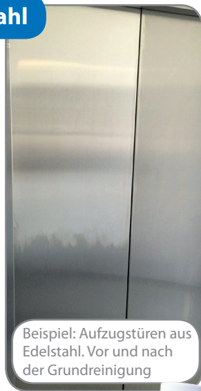
Beispiel: Aufzugstüren aus Edelstahl. Vor und nach der Grundreinigung

Mit Blitz TENSO A und Blitz MAGIC bringen wir Edelstahl wieder zum Glänzen!